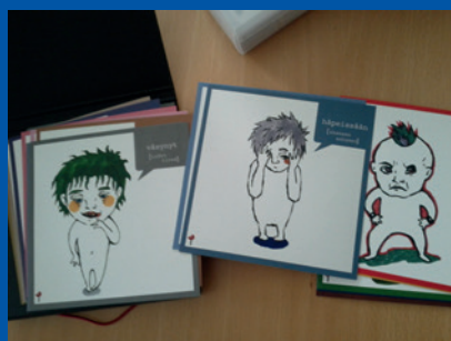
Finland, Kuovola. Materiaal dat tijdens het horen van kinderen wordt gebruikt, afhankelijk van hun leeftijd en ontwikkeling.