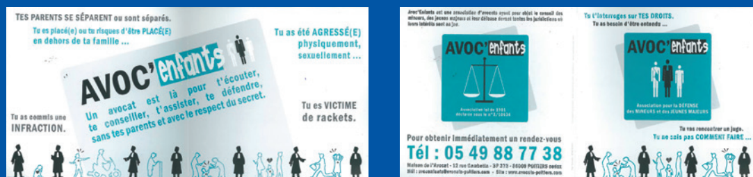
Dit is een reclame voor een kinderadvocaatprogramma (Avoc'enfants), waarbij kinderen en jongvolwassenen die bij een civiele of strafzaak betrokken zijn, contact kunnen leggen met een advocaat gespecialiseerd in kinderaangelegenheden voor advies en informatie over hun rechten.

In Frankrijk zijn in diverse steden contactpunten opgericht waar kinderen bij gespecialiseerde advocaten terecht kunnen voor informatie over hun rechten en voor advies en ondersteuning betreffende civielrechtelijke of strafrechtelijke aangelegenheden. De gesprekken zijn kosteloos en vertrouwelijk. Deze contactpunten bieden vaak ook een vorm van open spreekuur, naast speciale hulplijnen en voorlichtingssessies op scholen.