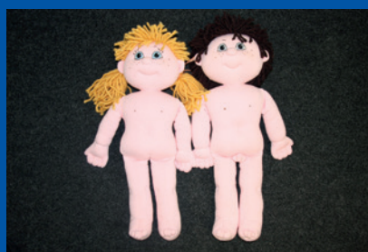
Tallinn, Estland. Poppen die bij het horen van kinderen worden gebruikt.

"[Informatie] is zeer belangrijk, want als wij niet duidelijk maken wat de rechten van het kind zijn, kan het kind die informatie nergens anders vandaan halen. [...] Ik denk dat het voor een kind een voordeel is als het weet dat het ergens op kan terugvallen; hierdoor zal het ook echt actief gebruik willen maken van die mogelijkheid." (Roemenië, psycholoog)