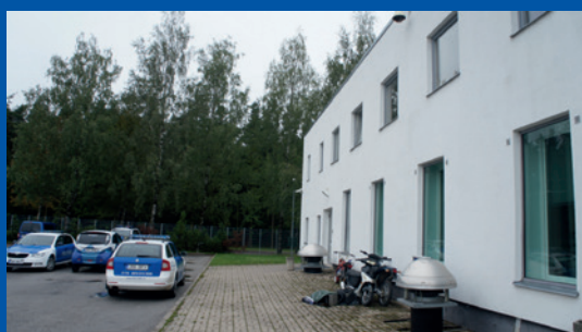
Estland. Aparte ingangen aan de achterkant van het Centrum voor slachtofferhulp van Tartu.

Het Centrum voor slachtofferhulp van Tartu ( Tartumaa Ohvriabikeskus ) in Estland heeft aan de achterkant een aparte ingang voor kinderen met speciale trauma's. Sommige rechtszalen in Finland hebben eveneens aparte ingangen; afzonderlijke ingangen en wachtruimten zijn hooggewaardeerde aspecten van de rechtbanken in het Verenigd Koninkrijk.