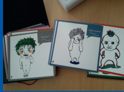
Finlandja, Kuovola. Materjal użat matul is-smiġh tat-tfal skont l-età u l-iżvilupp tagħhom.