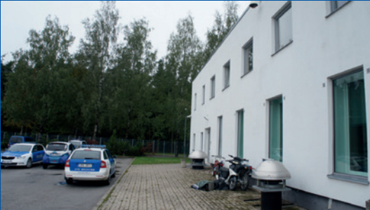
I-Estonja. Entratura separata fuq in-naħa ta' wara tal-bini ta' Ċentru ta' Appoġġ għall-Vittmi ta' Tartumaa.

Iċ-Ċentru ta' Appoġġ għall-Vittmi ta' Tartumaa ( Tartumaa Ohvriabikeskus ) fl-Estonja waqqaf entratura separata fuq in-naħa ta' wara tal-bini għal tfal ferm trawmatizzati. Xi awli fil-Finlandja għandhom ukoll entraturi separati, u entraturi separati u kmamar ta' stennija huma aspetti apprezzati ħafna tal-qrati fir-Renju Unit.