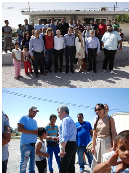
Megara – le maire visite le quartier rom au cours d'une réunion afin d'expliquer le processus de recherche et de mobiliser les citoyens ; des activités d'information ont souvent été menées dans le quartier.

partie suppose être claires et simples peuvent être comprises ou interprétées différemment par d'autres acteurs. Ces (dés)accords sont souvent attribués à la manière dont les informations essentielles sont communiquées, tant à l'intérieur qu'à l'égard des communautés.