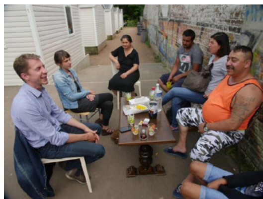
Lille – les travailleurs sociaux de l'AFEJI participent à une réunion des groupes d'expression en dehors des foyers des familles roms. Les groupes d'expression ont permis aux Roms de faire entendre leurs préoccupations, leurs besoins et leurs idées.

important de répondre aux besoins fondamentaux, tels que le logement adéquat, l'accès aux soins de santé, l'éducation et l'emploi, avant d'adopter des formes plus abstraites d'action de développement communautaire. Selon la recherche, il est essentiel, pour soutenir l'engagement de la population locale, d'instaurer un climat de confiance avec les communautés roms et les autorités locales, de surmonter les schémas de participation ritualiste, de résoudre les conflits ou les tensions croissantes, et de se rendre compte que la participation ne peut être imposée par la force.