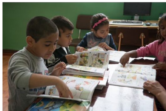
Pavlikeni – L'intervention locale s'est concentrée sur les initiatives éducatives, y compris le soutien à la participation à l'éducation des jeunes enfants

Les mécanismes de financement actuels ont également tendance à se concentrer sur des réalisations et des résultats mesurables afin de déterminer le succès des projets et maintenir l'obligation de rendre des comptes aux donateurs et aux dispositifs de financement. Cependant, tous les résultats significatifs ne sont pas mesurables en termes d'indicateurs quantitatifs. L'impact important des processus participatifs et des effets plus subtils, tels que l'autonomisation et l'évolution du tissu social des communautés, est difficile à saisir et n'est généralement pas reflété dans l'évaluation des projets. La valeur de la mise en œuvre d'approches participatives risque d'être perdue si elle ne se reflète pas dans les mécanismes formels de compte rendu des projets.