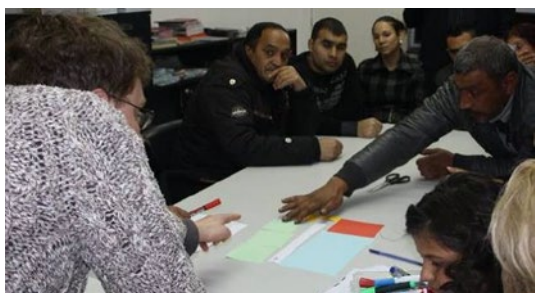
Stara Zagora – des habitants locaux du quartier de Lozenetz discutent de leur logement idéal et de leur plan de logement idéal lors d'une discussion de groupe ciblée en février 2016.

sur des échéances plus courtes et de nouer le dialogue avec les personnes de manière plus approfondie et plus participative. Il est également essentiel, pour que la confiance et la participation soient durables, d'apporter des changements tangibles qui répondent aux besoins de la communauté et de travailler sur des sujets de préoccupation communs aux Roms et aux non-Roms.