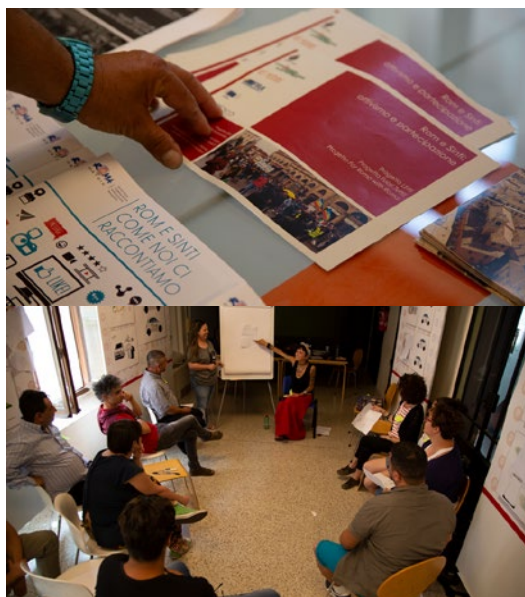
Bologne — Les Sintis et Roms locaux discutent de leurs points de vue sur les principaux défis de l'inclusion sociale et le manque de porte-parole et de médiateurs communautaires.

Les « principaux promoteurs » au sein des communautés locales, souvent en raison de leur rôle ou de leur personnalité, ont une influence importante sur la mise en œuvre et le succès des activités locales. Ils peuvent être essentiels pour inciter les individus à participer, pour renforcer la confiance dans les responsables de la mise en œuvre et dans les activités des projets, ainsi que pour accroître la crédibilité des projets. Lorsque les projets prennent en compte ces principaux promoteurs, ces derniers peuvent contribuer à atteindre d'autres membres de la communauté et les impliquer dans les activités et projets locaux.