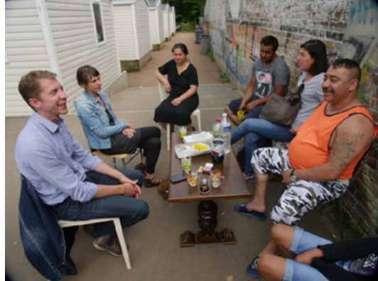
Lille – AFEJi sotsiaaltöötajad osalevad väljendusrühmade koosolekul, mis toimub roma perekondade kodude juures. Väljendusrühmad andsid romadele võimaluse rääkida muredest, vajadustest ja ideedest.

Kohalikes inimestes huvi tekitamine ja nende algatustesse kaasamine võib olla keeruline. Nad tahavad teada, kuidas kavandatavad meetmed suudavad lahendada nende kõige pakilisemaid vajadusi, ning projektides osalemine võib mõnikord nende igapäevaprobleemidest kaugena tunduda. Erieesmärkide kokkuleppimine ja konkreetsete tulemuste pakkumine, mis toovad inimestele tuntavat – kuitahes väikest – kasu, aitab tagada projektides ja muus kaasamistegevuses osalemist. Samuti võib olla oluline tegelda põhivajaduste rahuldamisega (nt korralik eluase, juurdepääs tervishoiuteenustele, haridusele ja tööle), enne kui võetakse kogukonna arendamise abstraktsemaid meetmeid. Uuringus leetakse, et kohalike elanike kaasatuse säilitamiseks on oluline tekitada romade kogukondades ja kohalikes omavalitsustes usaldust, välistada näilised osalusviisid, lahendada konfliktid või kasvavad pinged ning mõista, et jõuga ei saa osalema sundida.