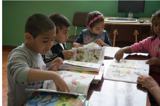
Pavlikeni – kohalik lähenemine keskkond haridusalgatustele, sealhulgas osalemise toetamisele väikelaste hariduse varases etapis.

Praegused rahastamismehhanismid keskenduvad sageli pigem mõõdetavatele väljunditele ja tulemustele, et määrata projektide edukus ning täita kohustusi rahastajate ja rahastamismehhanismide ees. Kuid kõik sisulised tulemused ei ole kvantitatiivsete näitajatega mõõdetavad. Osalusprotsesside olulise mõju ja vähem märgatavate tulemuste (nt võimesamine ja kogukondade sotsiaalse struktuuri muutused) mõõtmine on keeruline ning ei kajastu tavaliselt projektide hindamises. Osaluspõhise lähenemisviisi rakendamise väärtus võib minna kaduma, kui see ei kajastu projekti ametlikes aruandlusmehhanismides.