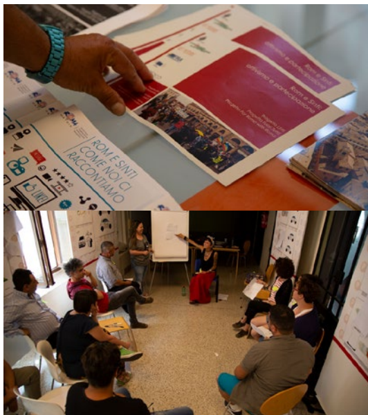
Bologna – kohalikud sintid ja romad arutlevad peamiste sotsiaalse kaasatuse probleemide ning kogukonna kõneisikute ja vahendajate puudumise üle.

või üksikusest. Nad võivad olla keskse tähtsusega tegijad üksikisikute osalema motiveerimisel, usalduse tekitamisel projektide rakendajate ja tegevuste vastu ning projektide usaldusvärsuse suurendamisel. Kui projektid arvestavad selliste keskse tähtsusega edendajatega, saavad nad aidata pöörduda muude kogukonna liikmete poole ning kaasata nad kohalikesse tegevustesse ja projektidesse.