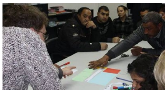
Stara Zagora – Lozenetzi naabruskonna kohalikud elanikud arutavad fookusrühma kogunemisel veebruaris 2016 oma ideaalset eluaset ja näidishoone lahendust.

Usalduse suurendamine ja keskse tähtsusega kohalike edendajate kindlakstegemine, kes on loonud kogukondadega usalduslikud suhted, on keeruline ja kompleksne protsess. Piirkondades, kus asjatundjad sisenevad kohalikesse kogukondadesse kogukondadele tundmatu väljastpoolt tulijana, on vaja investeerida väga palju aega ja energiat usaldussuhete loomisesse ning arendamisse. Piirkondades, kus kaasamistegevusi rakendavad juba usaldusväärsed isikud ja kus need tuginevad olemasolevatele usaldusvõrgustikele ja -suhetele, on neil võimalik tegevusi kiiremini korraldada ning inimestega põhjalikumalt ja kaasavamalt suhelda. Et usaldus ja osalemine oleksid kestlikud, on samuti oluline saavutada kogukonna vajadustele vastavaid tuntavaid muutusi ning töötada läbipaistvalt romade ja muu kogukonna jagatud probleemidega.