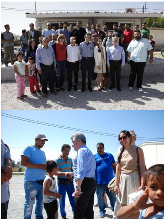
Megara – linnapea külastab romade linnaosas toimunud koosolekut, et selgitada uuringuprotsessi ja mobiliseerida inimesi osalema; linnaosas toimus sageli hõlmamistegevusi.

Asjakohane ja kohandatud teabevahetus kohaliku poliitika, strateegiate ja projektide kohta on väga oluline selleks, et hallata kohalike elanike ootusi ning tagada integratsiooni edu. Kogukondade teavitamine projekti eesmärkidest, meetoditest ja piirangutest on paljudel juhtudel sama oluline kui teave ise. Mõnikord võivad muud osalised teavet, mida üks osaline selgeks ja lihtsalt mõistetavaks peab, teisiti mõista või tõlgendada. Sellist (väär) mõistmist seostatakse sageli sellega, kuidas olulist teavet edastatakse, nii kogukondadele kui ka nende sees.