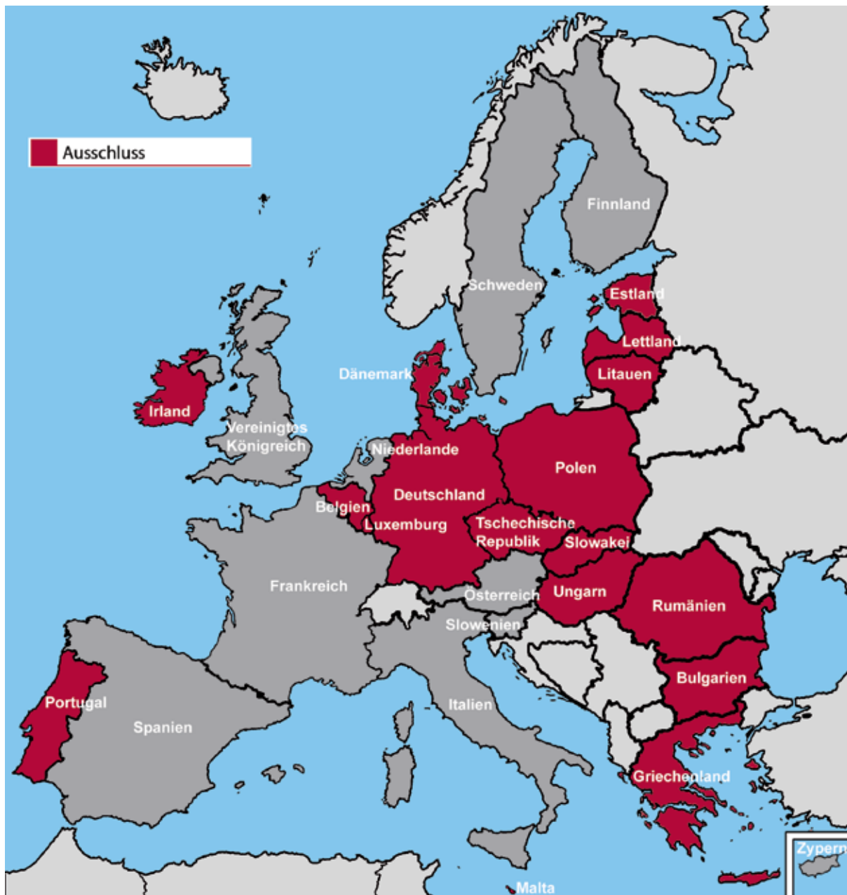
Karte 1: Ausschluss vom Recht auf politische Teilhabe in der Europäischen Union

Hinweis: Ein Land kann auf mehr als einer Karte erscheinen, da Menschen mit psychischen Gesundheitsproblemen und Menschen mit geistiger Behinderung unterschiedlich behandelt werden können.