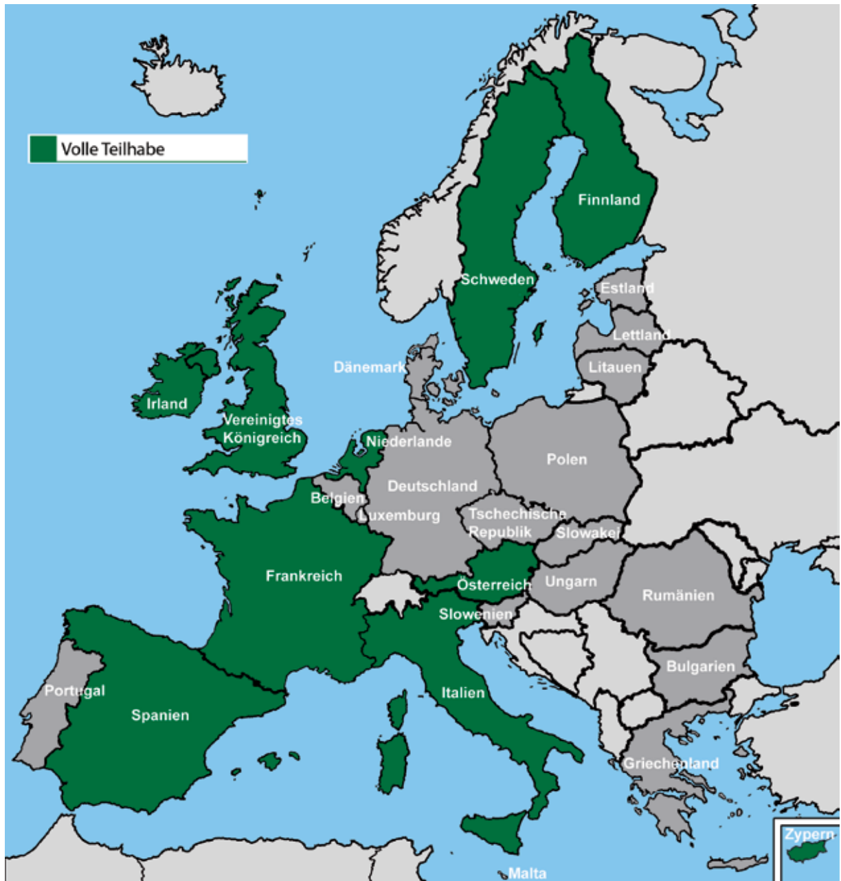
Karte 3: Volle politische Teilhabe in der Europäischen Union

Hinweis: Ein Land kann auf mehr als einer Karte erscheinen, da Menschen mit psychischen Gesundheitsproblemen und Menschen mit geistiger Behinderung unterschiedlich behandelt werden können.