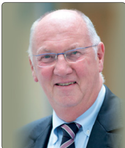
Michel Lebrun Präsident des Ausschusses der Regionen